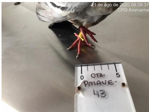
Figura 1.3 – Animal anilhado (Errata ID: CTA-PMAVE-PERENCO-04).