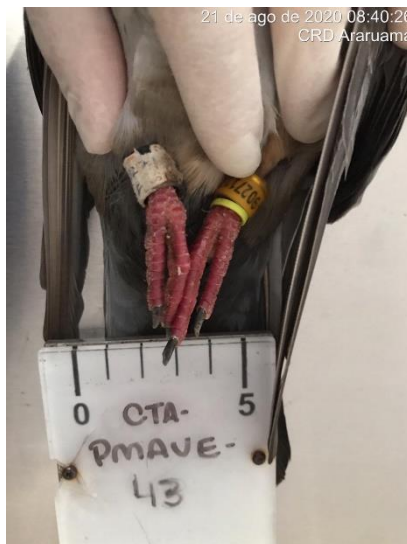
Figura 1.2 – Animal anilhado (Errata ID: CTA-PMAVE-PERENCO-04).