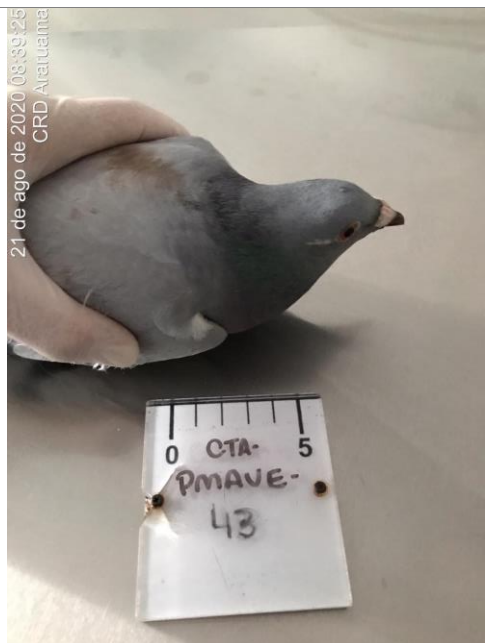
Figura 1.1 – Animal em exame clínico (Errata ID: CTA-PMAVE-PERENCO-04).