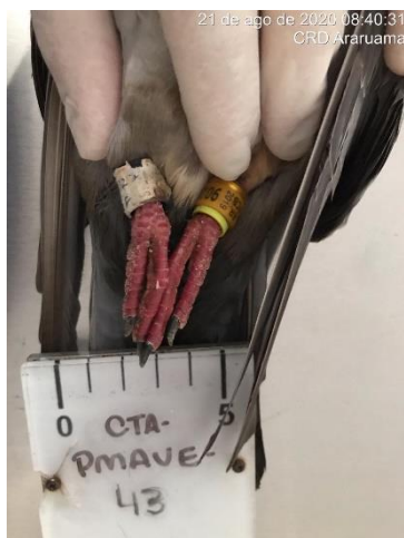
Figura 1.5 – Animal anilhado (Errata ID: CTA-PMAVE-PERENCO-04).