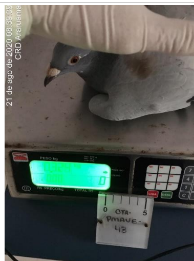
Figura 1.6 – Pesagem (Errata ID: CTA-PMAVE-PERENCO-04).