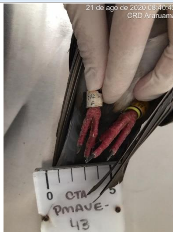
Figura 1.4 – Animal anilhado (Errata ID: CTA-PMAVE-PERENCO-04).